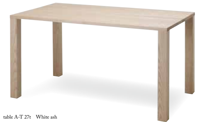
table A-T 27t White ash