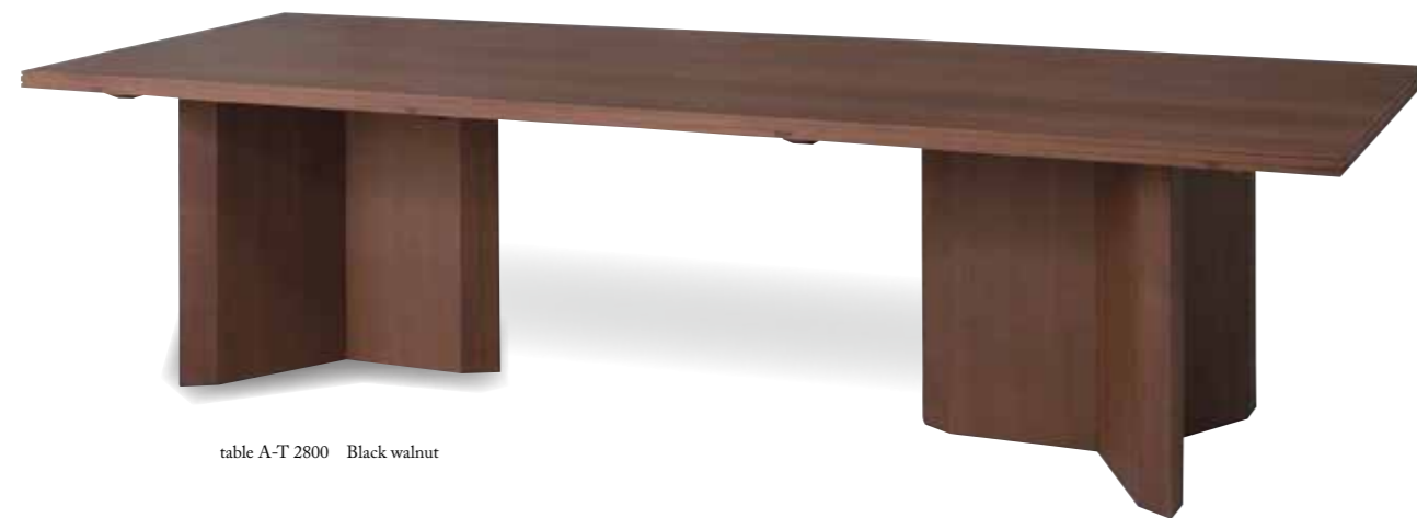
table A-T 2800 Black walnut

温かい触り心地があれば、無垢材テーブルに余計な装飾は不要。むしろ冷たいくらいシンプルなデザインがよい。無駄を一切排除することで強調される無垢材の質感。