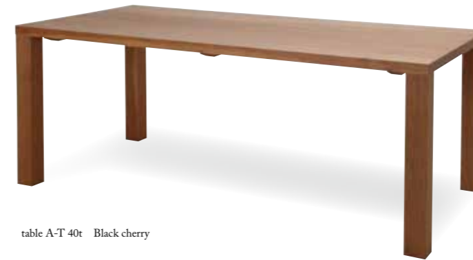
table A-T 40t Black cherry